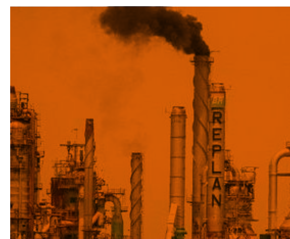
Óleo e Gás